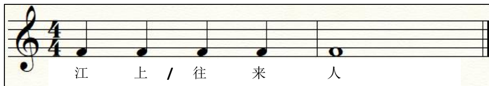
Rajah 3. Motif corak irama dalam puisi klasik Jiang Shang Yu Zhe (江上渔者)

Seperti biasa, irama dicipta berdasarkan jeda mendeklamasi puisi klasik tersebut. Puisi klasik Jiang Shang Yu Zhe (江上渔者) terdiri daripada lima patah perkataan dalam sebaris. Jeda untuk mendeklamasi puisi ini adalah “2/3”. Oleh itu, motif corak irama yang dicipta untuk puisi ini adalah berbeza dengan puisi klasik Cun Ju (村居), iaitu mengandungi nilai krocet dan semibrif.