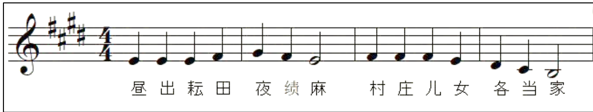
Rajah 6. Contoh melodi yang dicipta bagi puisi klasik Si Shi Tian Yuan Za Xing (四时田园杂兴)

pergerakan melodi secara mendatar dan bertangga banyak digunakan dalam ciptaan melodi puisi tersebut. Pergerakan melodi secara mendatar dapat menggambarkan kesungguhan buruh petani semasa bekerja manakala melodi bertangga pula digunakan supaya lebih mudah dinyanyikan.