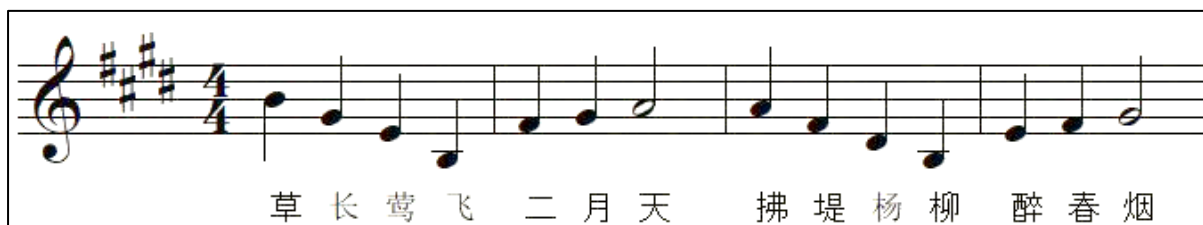
Rajah 2. Contoh melodi yang dicipta bagi puisi klasik Cun Ju (村居)

Dari segi melodi bagi puisi klasik Cun Ju (村居), ia bernada major kerana puisi ini menggambarkan suasana ceria di luar bandar. Melodi yang dicipta sesuai dengan renj suara murid Tahun 3 iaitu dalam lingkungan not B3 hingga D5 yang merupakan tesitura suara ( average renj ) golongan tersebut (Pravina Manoharan, 2007). Teknik arpeggio digunakan dalam melodi puisi tersebut kerana menurut McQuiston (2013), melodi dalam bentuk arpeggio dapat menggambarkan kegembiraan dan kebahagiaan. Melodi bertanggung juga telah digunakan supaya lebih mudah untuk dinyanyikan oleh responden.