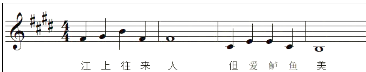
Rajah 4. Contoh melodi yang dicipta bagi puisi klasik Jiang Shang Yu Zhe (江上渔者)

Puisi klasik Jiang Shang Yu Zhe (江上渔者) telah memberi gambaran tentang kehidupan nelayan di kampung yang tenang. Justeru, nada major digunakan dan melodinya berada dalam lingkungan not B3 hingga D5 agar lebih mudah dinyanyikan oleh responden yang berumur 9 tahun. Pergerakan melodinya berlaku secara bertangga, mendatar dan sedikit melompat. Hal ini kerana pergerakan melodi sedemikian dapat menggambarkan situasi nelayan menangkap ikan di dalam laut yang kadang-kadang tenang, kadang-kadang berombak.